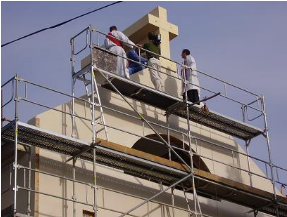
Pohled na kropení kříže svěcenou vodou