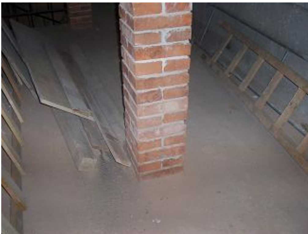
detail - na kûru