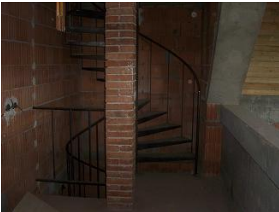
schodiště do věže