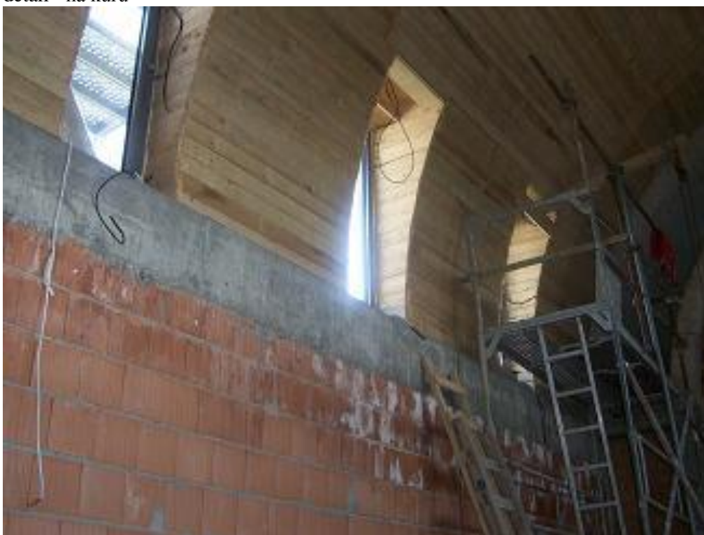
pohled na okna