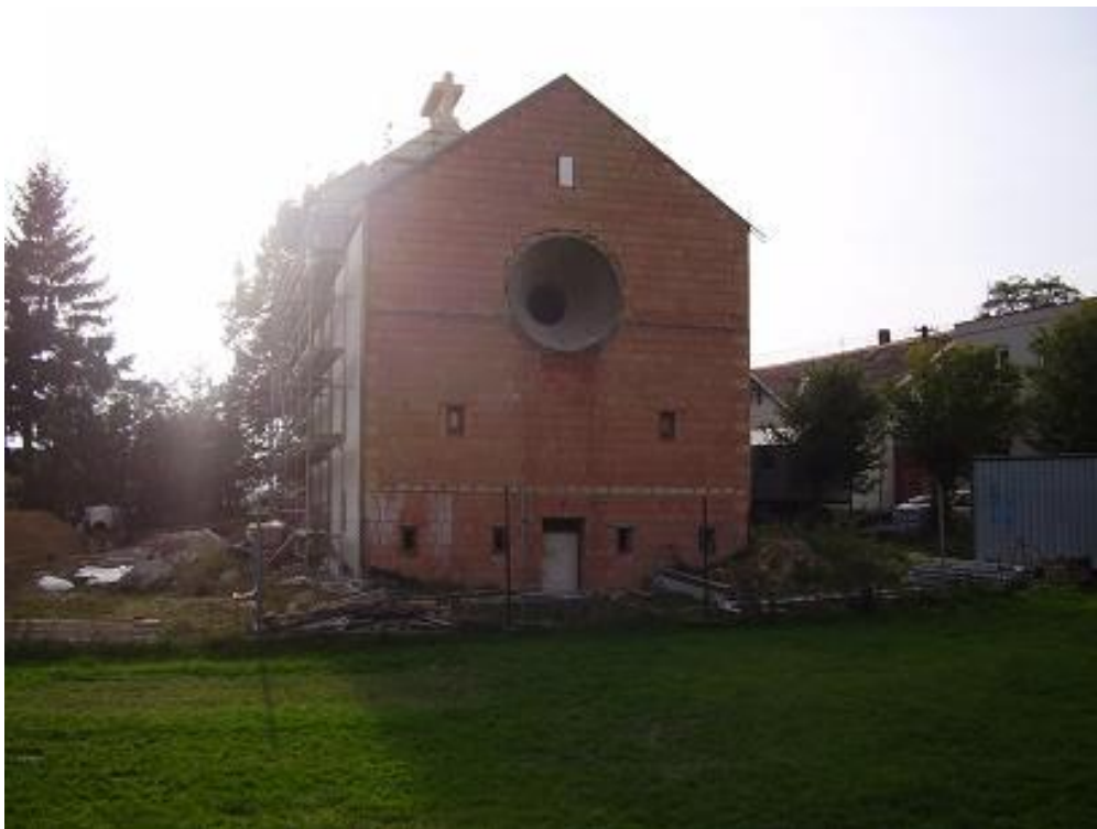
Pohled na rozestavěný kostel od bytovek