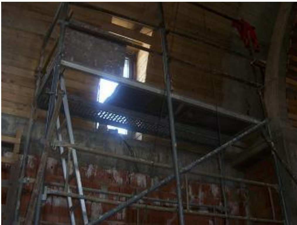
lešení u okna