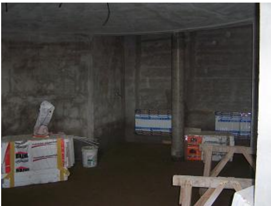
budoucí klubovna v suterénu