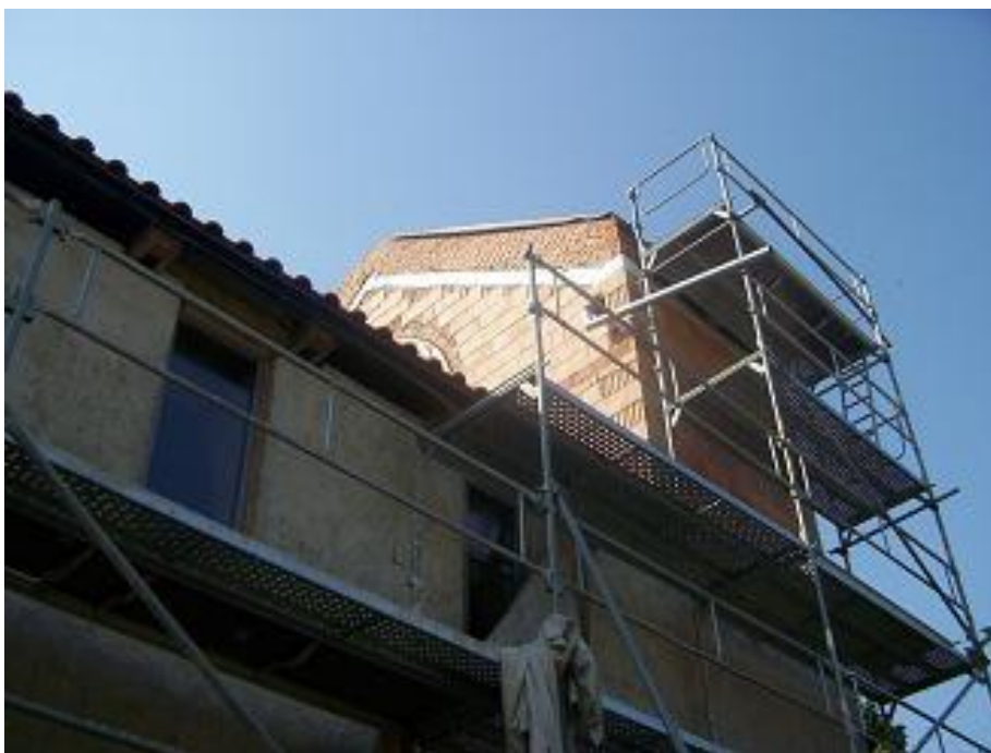
pohled na věž kostela