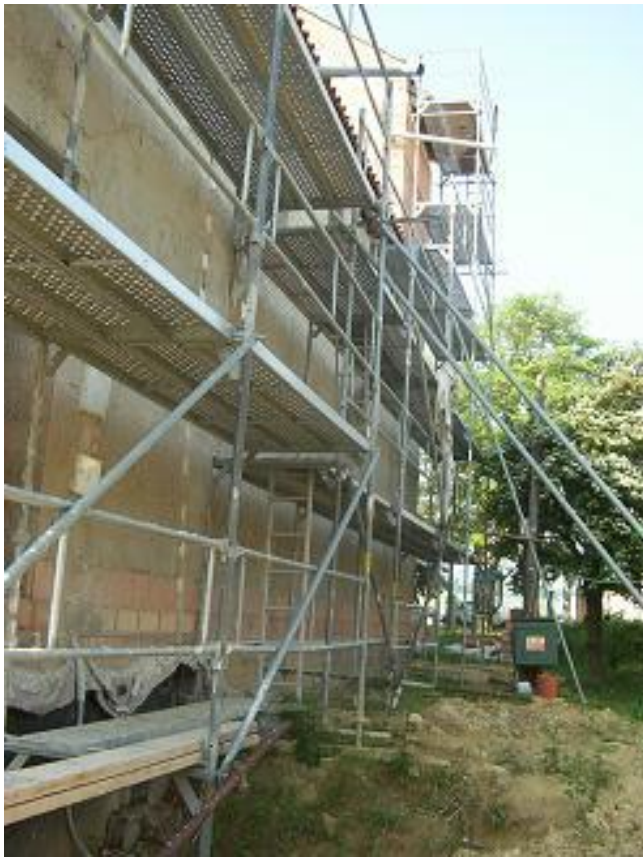
pohled z boku