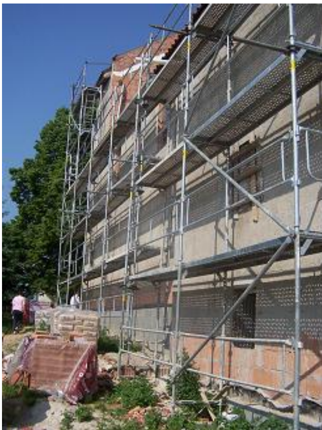
lešení u kostela