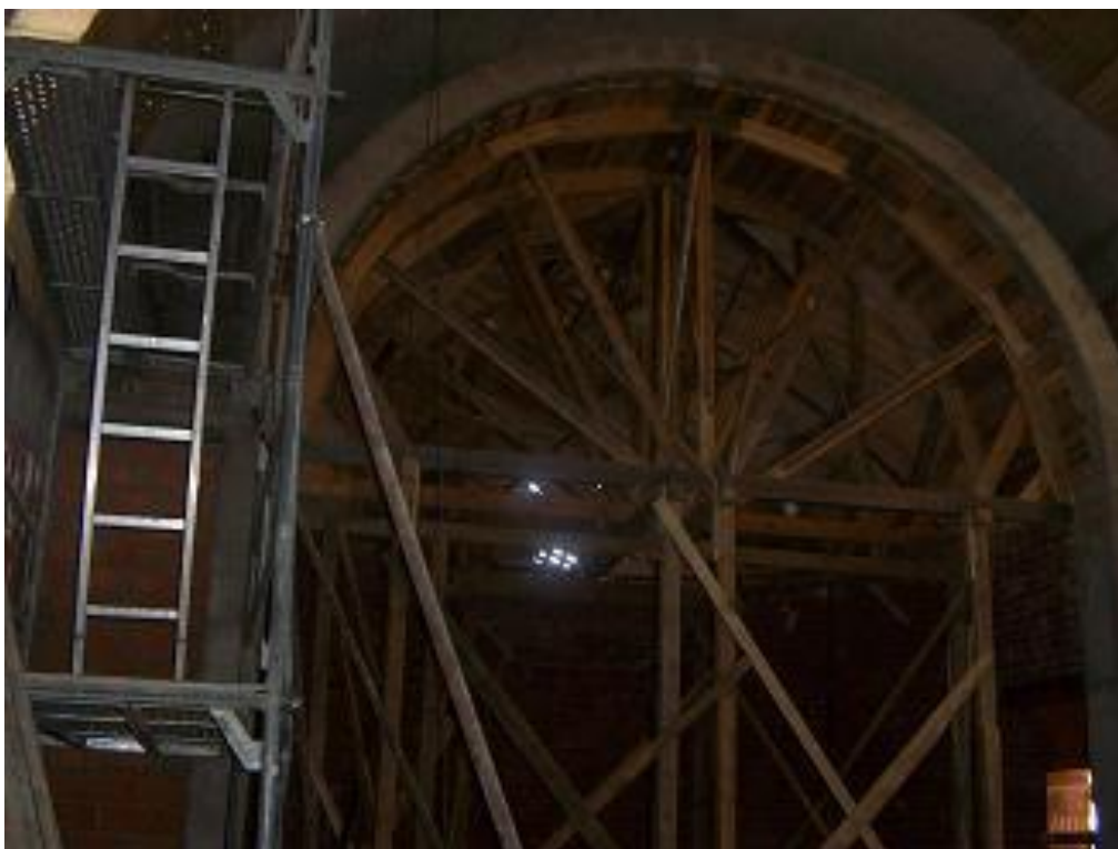
pohled do presbytáře