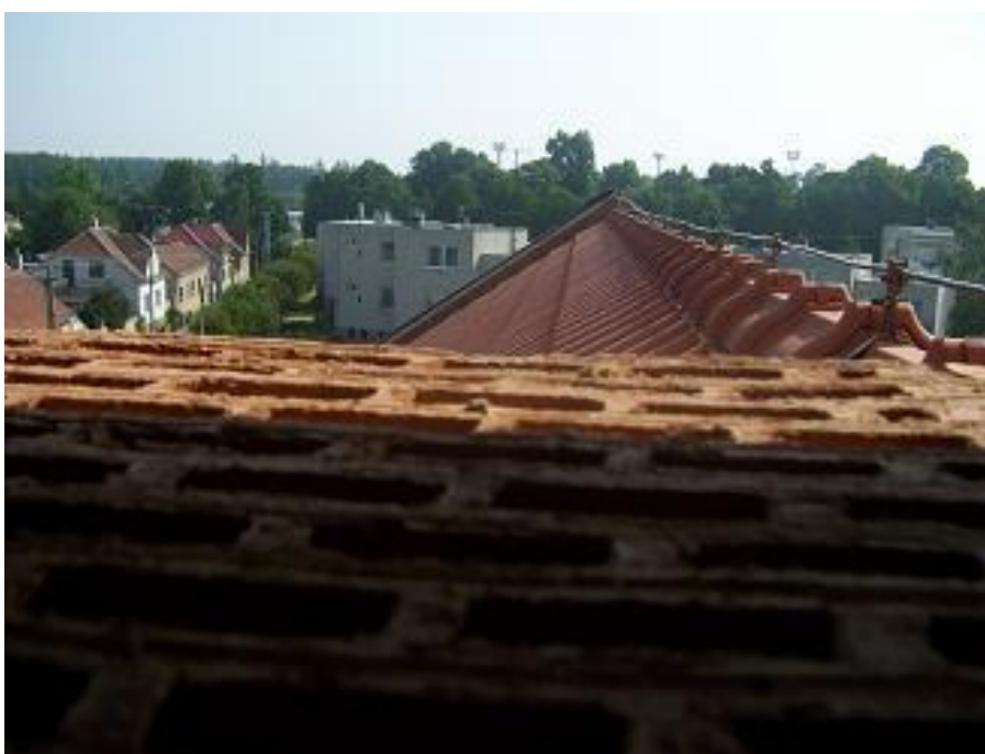
Výhled z věže